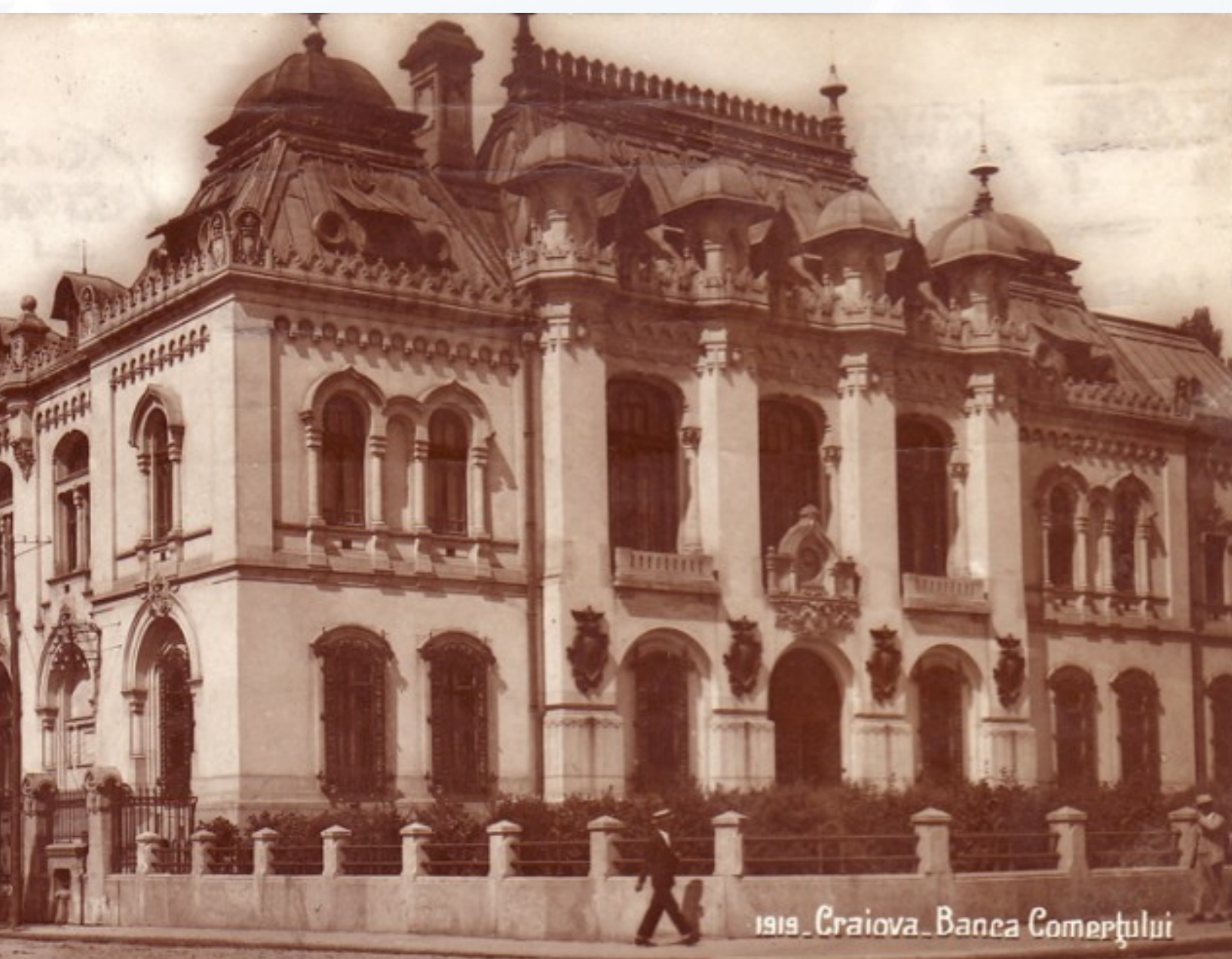
1919 Craiova Banca Comerțului